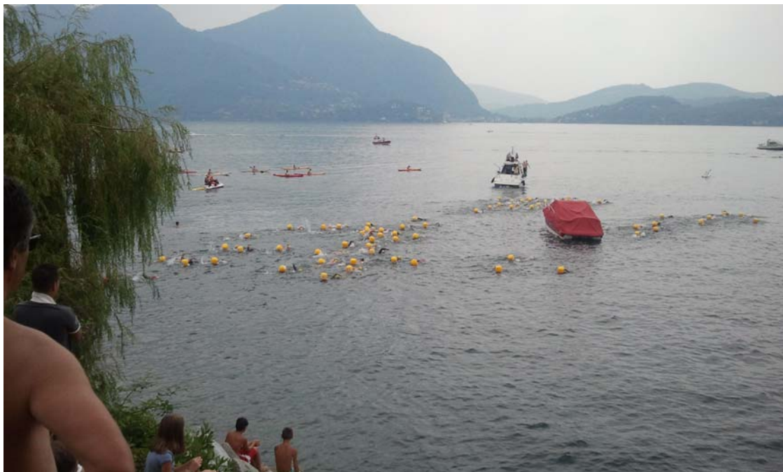
La partenza dall'Arena di Pallanza.

Con questa newsletter, l'attività della sezione di Verbania si sospende per le meritate vacanze e riprenderà il 04 settembre.